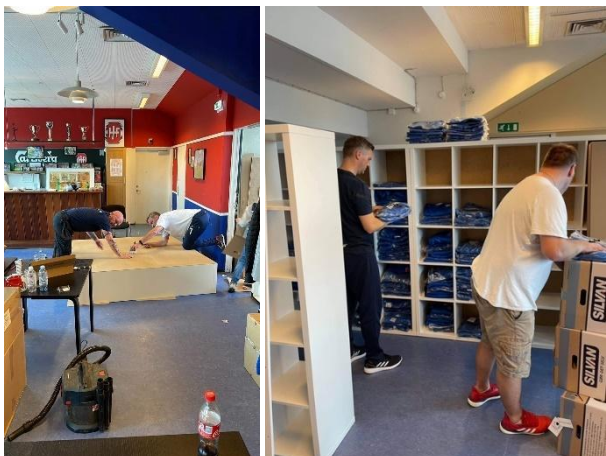
Billede: Bestyrelsen i gang med at etablere klubbens lager og trykkeri på stadion.