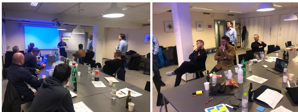
Billede: Bestyrelsen og afdelingsledere på første workshop vedr. Hvidovre strategi og fokusområder. Basis var en SWOT analyse.

Efter et første år, hvor den relative nye bestyrelse har brugt meget tid på brandslukning og skabe overblik, er det tid til at fokusere på udvikling. I januar 2022 gennemførte bestyrelsen sammen med afdelingsledere og gruppeledere første strategi workshop – SWOT analyse – for at identificere fremadrettede fokusområder. I 2022 forventes det at fortsætte dette arbejde.