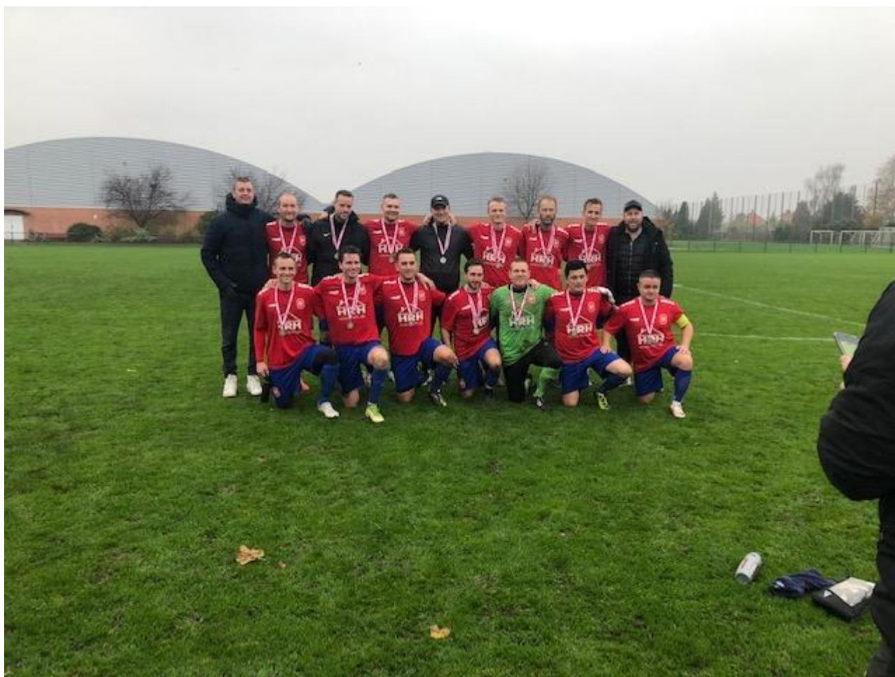
Billede: Hvidovre IF M32 hold (Old Boys) vinder rækken og spiller landsdækkende finale mod OB, der desværre tabes efter et tidligt rødt kort til Hvidovre IF.