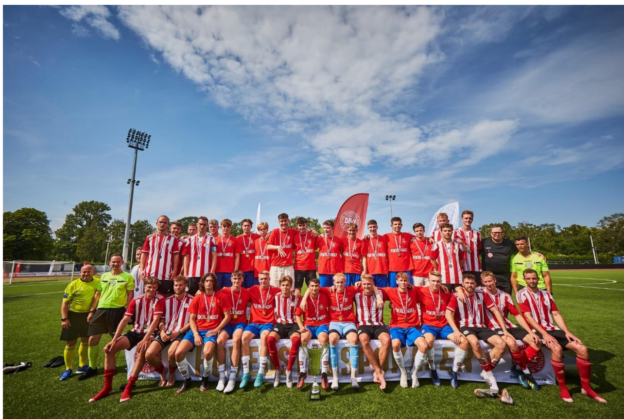
Billede: Hvidovre IF U23 vandt Hovedstadspokalen den 26. juni 2022, hvor holdet sikkert vandt 1-3 over Østerbro IF.