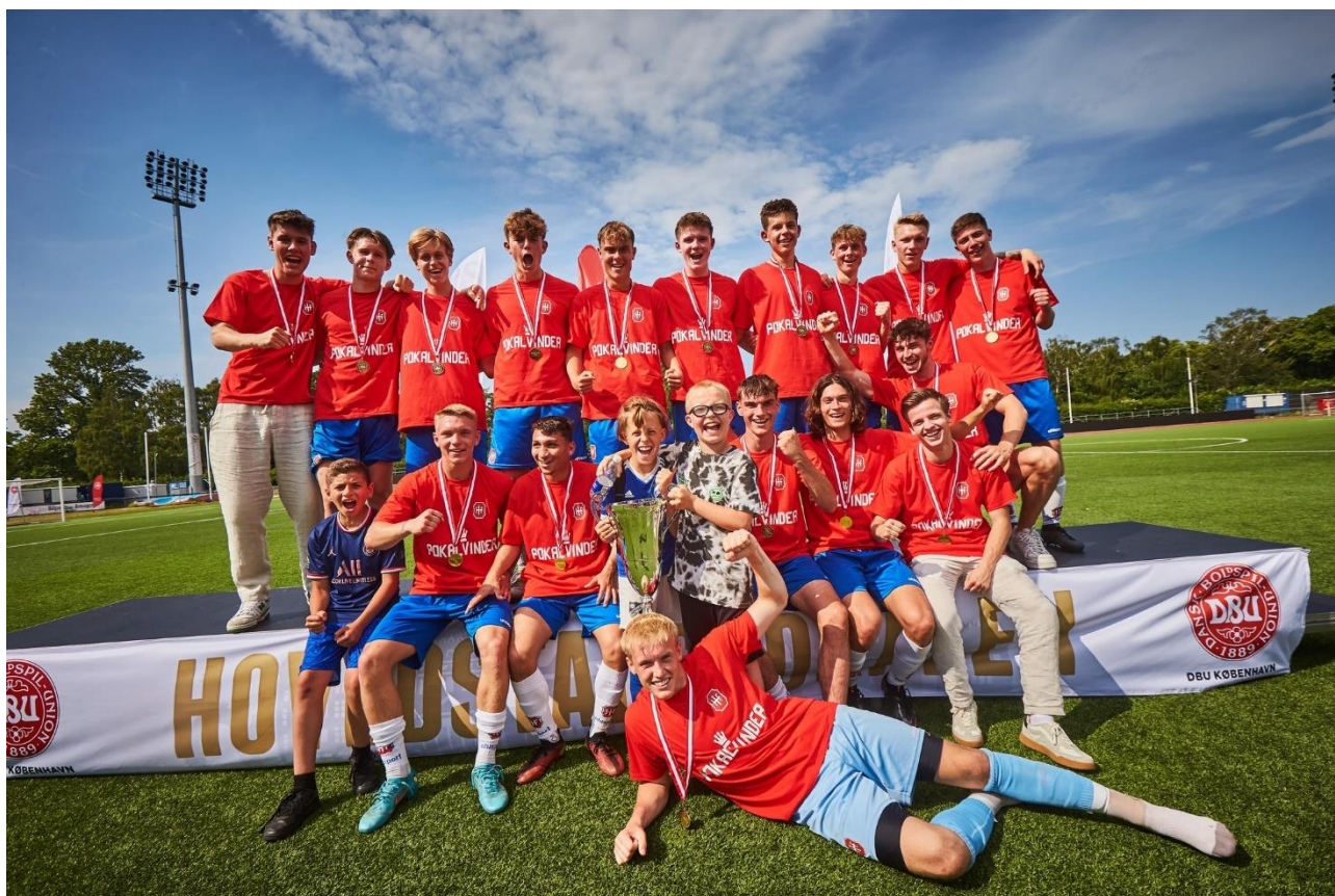
Billede: Hvidovre IF U23 vandt Hovedstadspokalen den 26. juni 2022, hvor holdet sikkert vandt 1-3 over Østerbro IF.

Hvidovre Idrætsforening, fodboldafdelingen Sollentuna Alle 1-3 2650 Hvidovre